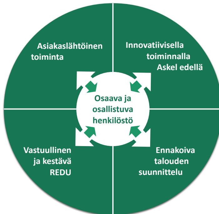
KUVA 2. Strategiset kehittämisen painopistealueet 2024

Seuraavilla sivuilla olevissa taulukoissa 1–5 on esitetty painopistealueittain toimintavuoden 2024 sitovat tavoitteet sekä niiden toteuttamiseen liittyvät keskeisimmät riskit.