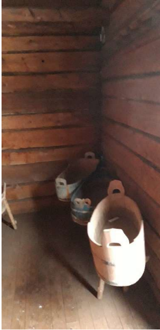
Kuvassa lasten kylpysaaveja

Kylillä ja kyläkunnilla oli omat lapsenpäästäjät, kupparit ja parantajat. Heillä saattoi olla yli- luonnollisia kykyjä tai noidan taitoja. Tuon ajan sairauksia olivat esimerkiksi ajokset, rohtumat, venymät, rokot, rupitaudit tai pistokset. Konsteja niiden hoitamiseksi oli monia. Kuolemaan tyy- dyttiin, mutta aina se oli häviö, pelottava ja peljättävä asia. Vainajan tekstiilit poltettiin, ruoka- astiat tiskattiin kuumalla vedellä, kumottiin ja savustettiin katajalla. Vainajan oli lähdeittävä ko- konaan, josta kertoo sanonta: ” Kaikkines lähe, kulje omin kyytines, älä mishän maalla käy, äläkä kelheen mithän teje ”. (Onnela 2006, 479). Pappia jouduttiin odottamaan yleensä pitkään, jolloin vainaja pestiin, valmisteltiin sekä hyvästeltiin saunassa. Riihessä vainajat säilytettiin tal- ven aikana.